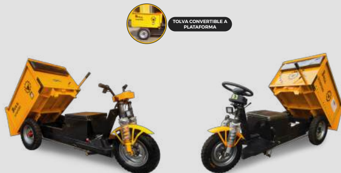
Con timón de moto

Motor: 850 watts | 1000 watts Voltaje: 48 v Capacidad de carga: 800 kg Dimensiones: 1200 x 700 x 950 mm