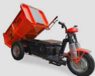
Con timón de moto