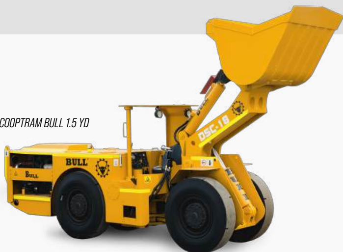
SCOOPTRAM BULL 1.5 YD