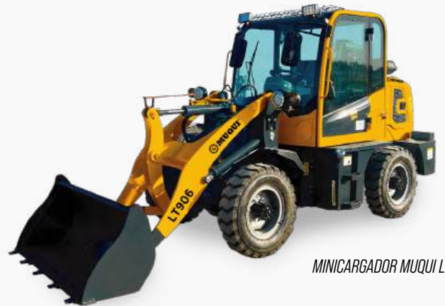
MINICARGADOR MUQUI LT906

Motor: Yunnei 55 Kw | 74 Hp Cilindros: 4 Capacidad de cubo: 0.4m 3 Capacidad de carga: 600 kg. Dimensiones: 4600 x 1210 x 2130 mm