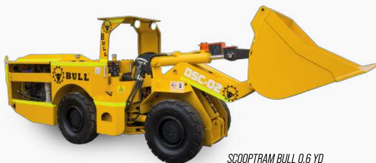
SCOOPTRAM BULL 0.6 YD