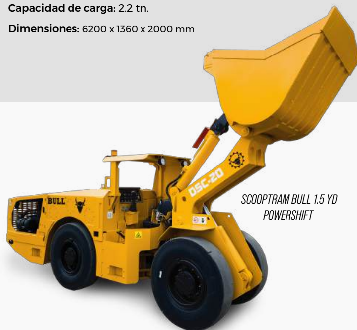
SCOOPTRAM BULL 1.5 YD POWERSHIFT