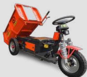
Con timón de dumper